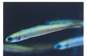
ゼブラハゼ 体長：約10 cm 臆病な性格で、水槽に入れたばかりの頃は、隠れてしまうことがあります。