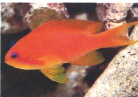
(インド) キンギョハナダイ 体長：約10 cm 温和な性格なので、気の強い魚との混泳には向いていません。