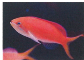
アカネハナゴイ 体長：約8 cm 群れを作ると落ち着くので、複数匹の飼育が向いています。